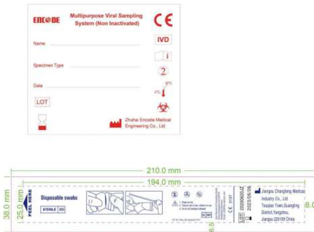
GAMBAR KEMASAN PRIMER